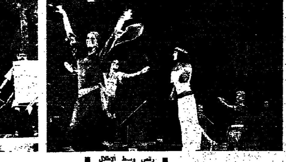
رض وسط اطلال